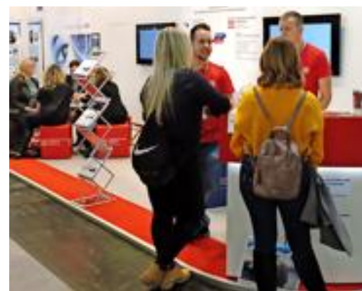
Die Technische Hochschule Brandenburg und Augenoptikerinnung Brandenburg beraten auf ihrem Stand die unterschiedlichsten Alters- und Interessengruppen.