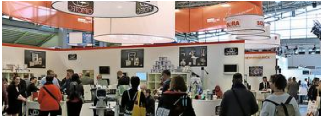
Dicht umlagert war der Gemeinschaftsstand, auf dem sich die Rathenower Unternehmen auf der Opti 2019 präsentierten.

Rathenower Unternehmen präsentieren sich auf Messe für Optik & Design in München