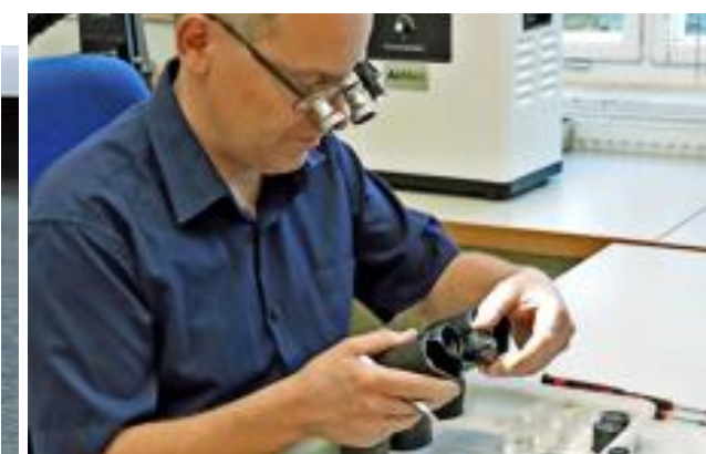
Obrira Low Vision aus Rathenow präsentiert eine neue Lupenbrille aus Titan, entwickelt in Kooperation mit MOM Rathenow, mit neuer kabelloser Beleuchtung. Sie erhöht den Arbeitskomfort, wie hier bei der Restauration von Zeiss-Ferngläsern.