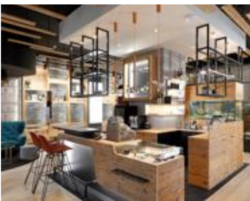
Tausende Kilometer legen die Mitarbeiterinnen und Mitarbeiter von Poschmann Design jährlich zurück, um für ihre Kunden das Augenoptikfachgeschäft ihrer Träume zu entwickeln und zu fertigen, wie hier in Rostock.