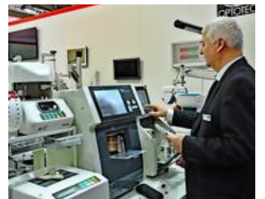
Langjährige und hohe Fachkompetenz der Mitarbeiter der Optotec GmbH sind eine Grundvoraussetzung für erfolgreiche Geschäftsabschlüsse.