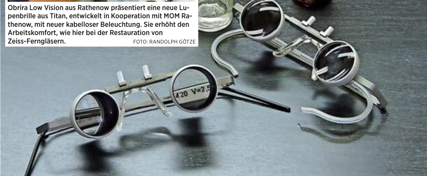
Obrira entwickelte die TTL-Lupenbrille in den letzten beiden Jahren. In Kooperation mit MOM-Rathenow wurde jetzt ein neues Trägergestell aus Titan entwickelt, das die Masse auf die Hälfte reduziert.