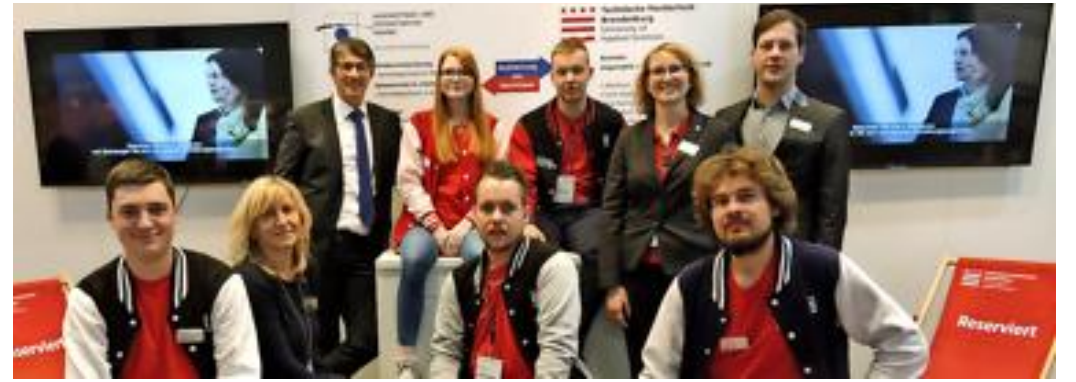
Als Gesprächspartner für Innungsmitglieder, Ausbildungs- und Studieninteressierte fungieren Professoren, Innungsmeister, Dozenten und Studierende der Einrichtungen.

Acht Rathenower Unternehmen und Organisationen stellen sich in diesem Jahr auf dem Gemeinschaftsstand der Länder Brandenburg und Berlin in Halle 4 dem Markt. Neben der OABB – Optic Alliance Brandenburg Berlin und der Augenoptiker- und Optometristeninnung des Landes Brandenburg sind auch die Unternehmen Obrira Low Vision Rathenow, Ophthalmica Brillengläser GmbH & Co. KG und die Optotec GmbH sowie Poschmann Design vertreten. Auch das Optik Industrie Museum Rathenow sowie die Technische Hochschule Brandenburg sind in München dabei.