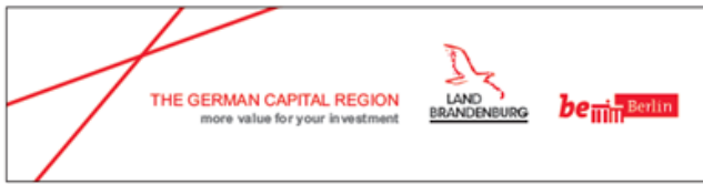
Großbanner mit Linienelement und Dachmarke mit Businessmarke in der Positivvariante auf Weiß